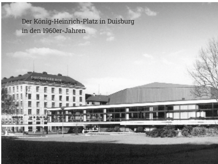
Der König-Heinrich-Platz in Duisburg in den 1960er-Jahren

Das Zentrum für Erinnerungskultur, Menschenrechte und Demokratie (ZfE) erinnert an die nationalsozialistische Vergangenheit Duisburgs. Daneben sind Migration sowie die Ausgrenzung und Diskriminierung diverser marginalisierter Gruppen zentrale Inhalte. Das ZfE arbeitet als Netzwerk, das mit Bildungsangeboten, Veranstaltungen und Ausstellungen die Auseinandersetzung mit diesen Themen in der Stadt fördert.