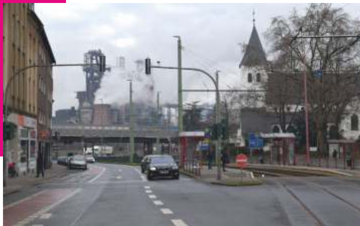
Friedrich-Ebert-Straße in Duisburg-Beeck